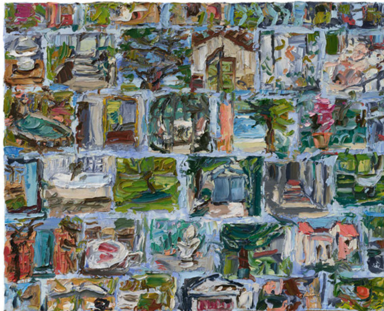
„souvenir à les cigales“, 61 x 77 cm, 2013, Öl auf Leinwand

Lesung mit Arnold Stadler , „Auf der anderen Seite meiner Augen“ Sätze für und über Maler. Von Bissier bis Schönfeld.