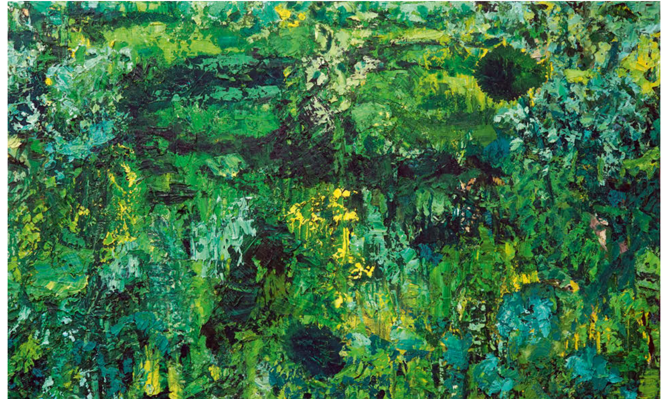
„wiesenstück“, 95 x 156 cm, Öl auf Leinwand von 2017