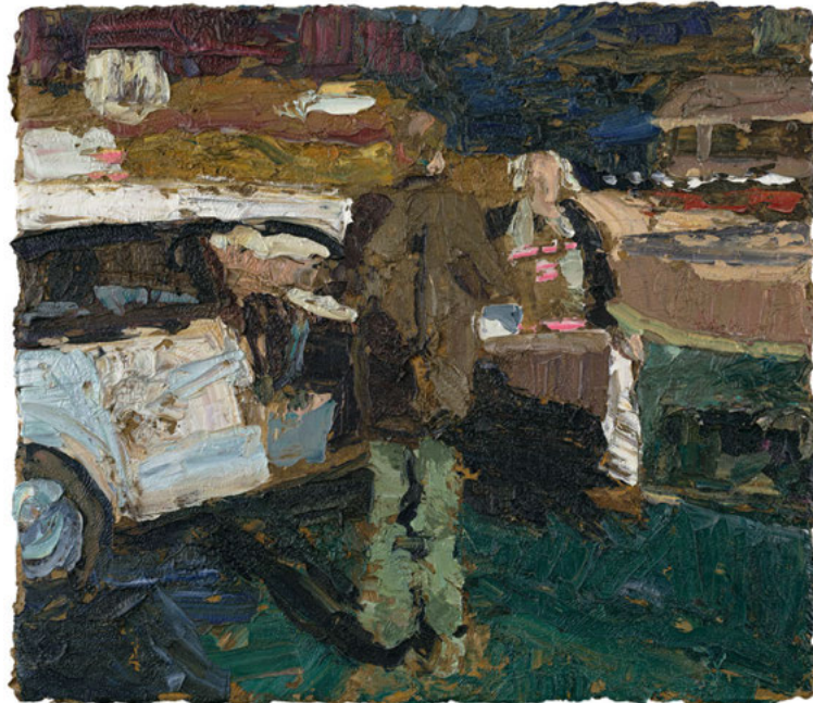
„abend vor kautzmann“, 38 x 44 cm, Öl auf Leinwand von 2008

„schönfeld malt fragwürdigkeiten. schönfeld fragt nicht, ist das gegenständlich oder abstrakt? der gegenstand von schönfelds malerei ist das leben & das material. es kommt drauf an, was man draus macht. mit man meint schönfeld jedermann, der augen hat zu sehen.“