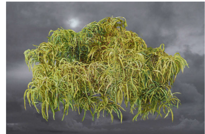
Cloud Bermuda 60 x 90 cm, 2019