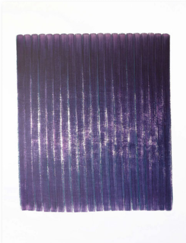
Aquarell, ca. 200 x 150 cm, 2020