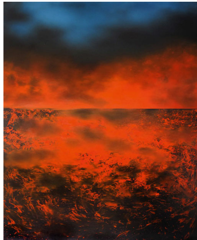
Nr. 443, 2019, Öl auf Leinwand, 200 x 160 cm