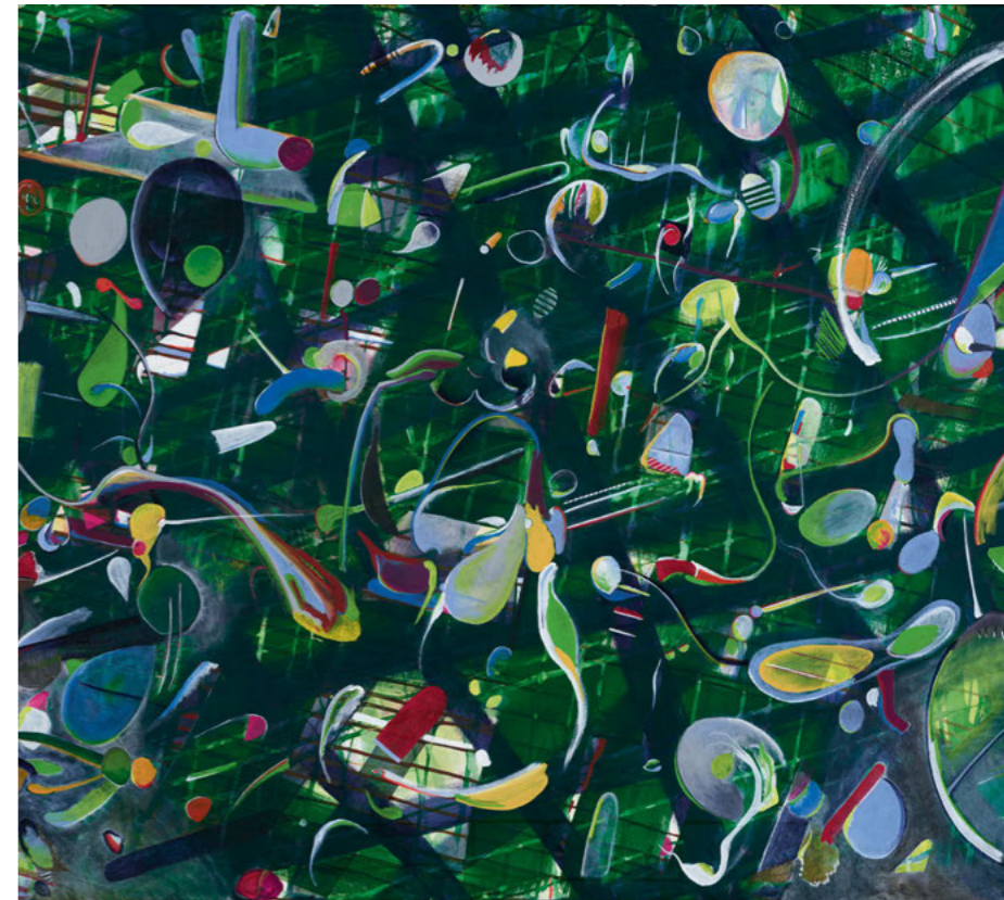
Detail: Schramberg 6 (Werk Nr. 646), 2022, Acryl auf Leinwand, 100 x 140 cm